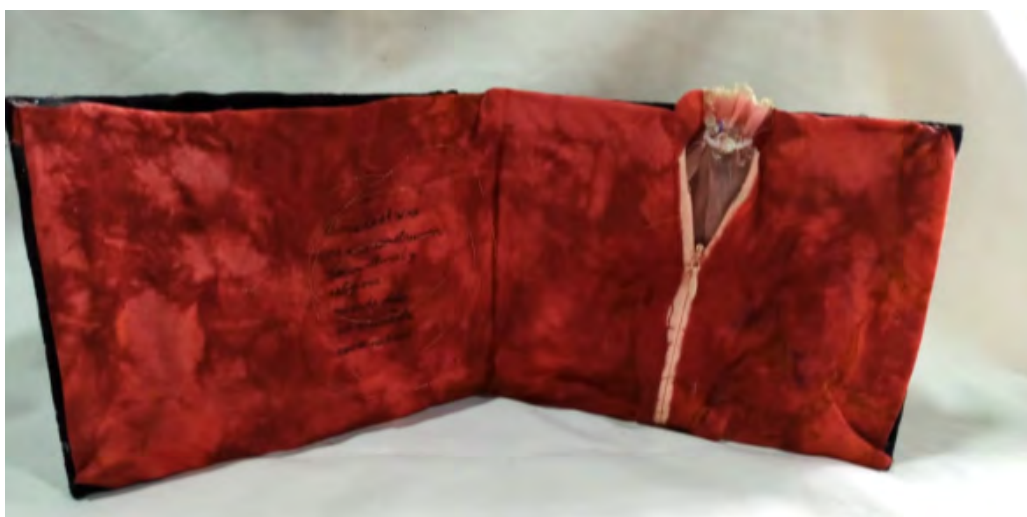
Figura 5: Fuente: Laura Ramírez, Tenía miedo de tener sexo hasta hace poco , pieza textil, Casa Canibal (CCECR)

El anonimato otorga un espacio de confianza donde juntas como bordadoras resolvemos sin juzgar, sin prejuicios y sin cuestionamientos los secretos de las otras.