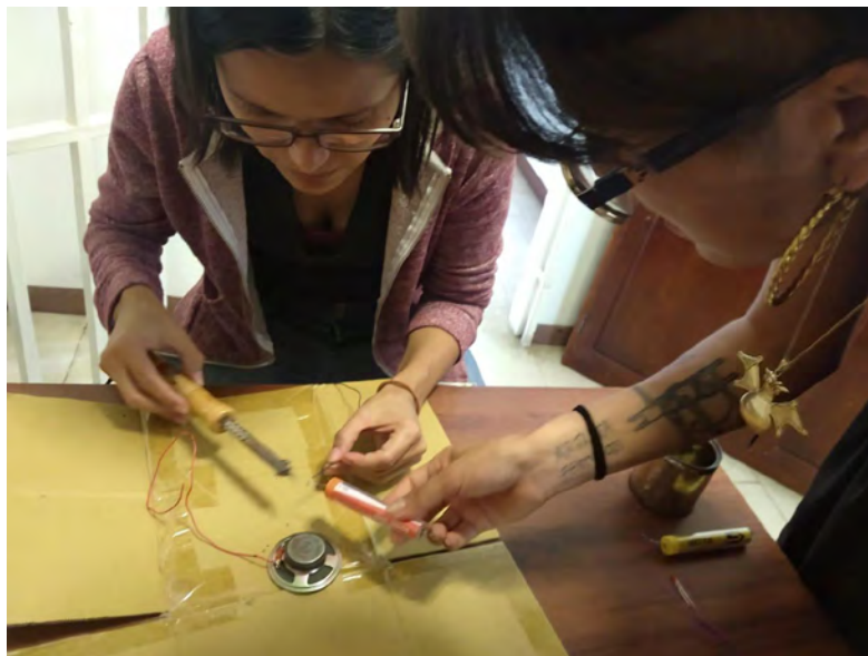
Figura 2: Jornada de trabajo.

íntimo de la costura y del bordado para, a través de un gesto performativo, pensar los territorios de las Otras –lo que nos permite, en definitiva, pensar también los propios. Se trató entonces de generar espacios de comunidad y de construcción identitaria.