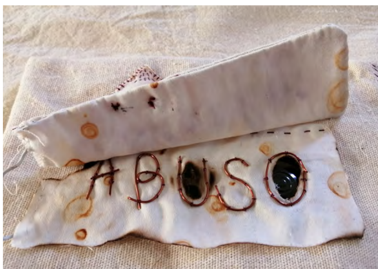
Figura 14 Fuente: Noelia Guzmán Álvarez, Lo sentí en el cuerpo, mi abuelo había abusado de m , pieza textil, Casa Canibal (CCECR)

Y es ese acto de reparar lo que me llena de la costura y el bordado, que además se convierten en un acto de reparación personal y de reflexión.