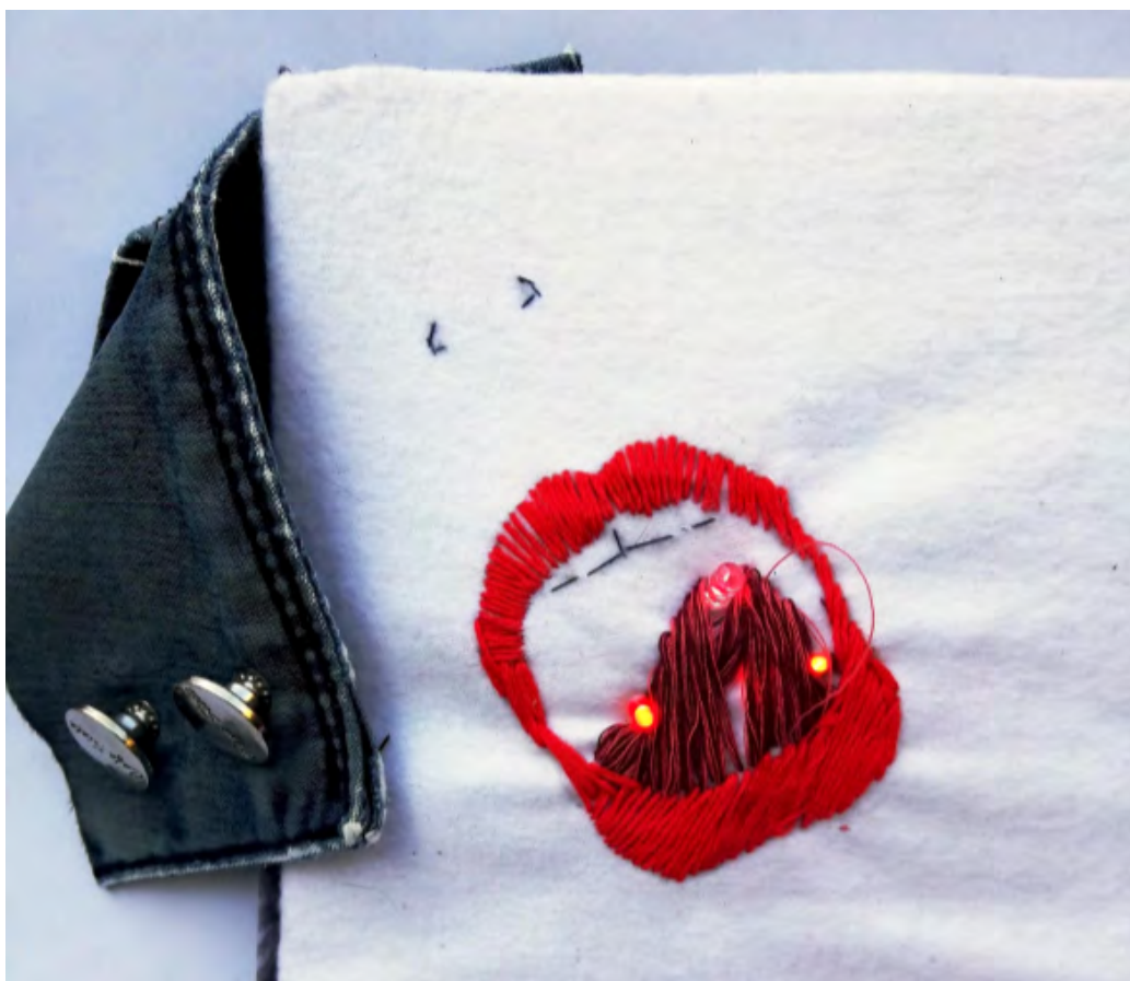
Figura 4: Fuente: Nuria Díaz, Me gusta que me cojan fuerte , pieza textil, Casa Canibal (CCECR)

Ilusión y admiración al ver a tantas mujeres, diversas y hermosas en el mismo afán. No me sentía sola, no era la única que pensaba revences, que creía en la posibilidad de resistir desde las mismas fibras de mi carne en un mensaje liberador, perturbador, de denuncia; desde mi frente inicial, desde donde niña estuve: entre telas, hilos y remiendos, materias primas de mi niñez, de mi feminidad (de mi vulnerabilidad pensará equivocadamente algunx), desde diferentes frentes y contextos. En el fondo se sentía un objetivo en común: reivindicación, redención, re-estructuración... resistencia... Por un momento ya no me sentía ajena, lejana. En algún momento fuimos un nosotras, un común, un juntas. El lapso duró poco, pero me dejó el convencimiento de que el potencial que se tiene es mucho, hay mucho que podemos lograr, y la comunidad, la red entre personas, esa cercanía y abordaje poniendo como eje o centro nuestra humanidad, ese contacto real, sin juicios, respetuoso y cuidadoso del otrx, es la clave para generar y mantener cambios tanto en la mediación como en la convivencia misma a través del tiempo.