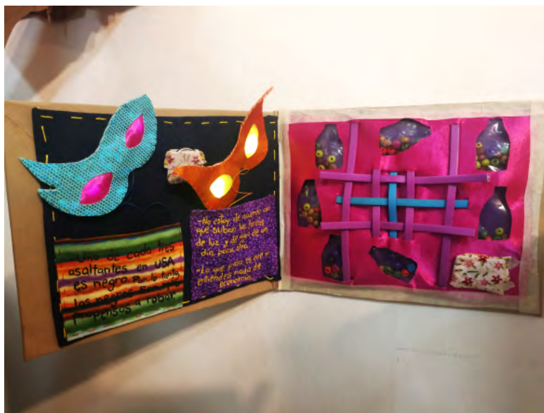
Figura 3: Fuente: Raquel Navarro, Aborrezco la lógica humana , pieza textil Casa Canibal (CCECR)