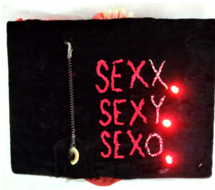
Figura 6: Fuente: Laura Ramírez, Tenía miedo de tener sexo hasta hace poco , pieza textil, Casa Canibal (CCECR)