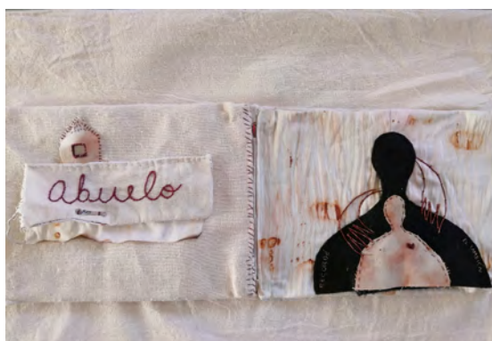
Figura 13 - Fuente: Noelia Guzmán Álvarez, Lo sentí en el cuerpo, mi abuelo había abusado de mí , pieza textil, Casa Caníbal (CCECR)

Pienso también en que el acto de decidir confiar y contar el secreto a una extraña, dejarlo ir aunque sea en el anonimato, resulta liberador. Poder finalmente verbalizar aquello que se ha mantenido escondido con tanto cuidado es una forma de hacer las paces con eso que se guarda.