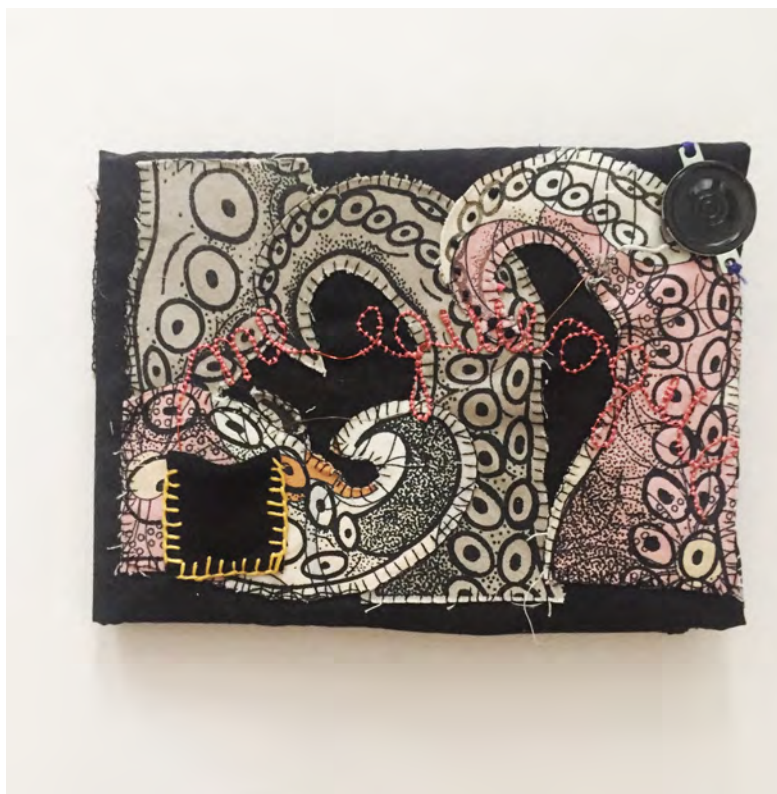
Figura 8: Fuente - Hannia Durán Sáenz, Me equivoqué y abandoné , pieza textil, Casa Canibal (CCECR)

Para la elaboración del libro decidí variar un poco el secreto y transformar la frase a “Me equivoqué y decidí abandonar” pues me parece que en toda acción media la voluntad y que es importante dar el crédito a ese ejercicio de llevar a cabo lo que pienso o deseo. En la portada se observan unos tentáculos enmarañados y si se abre el libro la transformación de esos tentáculos a un ave que vuela. En la portada hay un circuito blando que acciona un parlante el cual produce un ruido blanco y que refuerza el sentir de confusión. en el interior otro circuito se encarga de alumbrar cada representación del proceso del paso de tentáculos a aves; dicho circuito se acciona utilizando como botón el estadio final de la transformación.