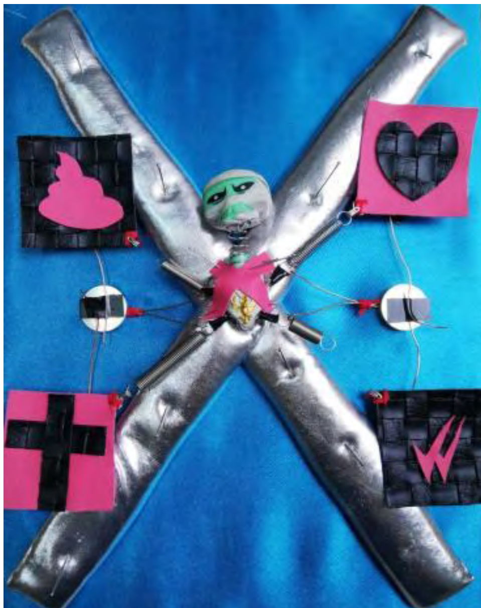
Figura 7 - Fuente: Jacqueline Alvarado, Fui expuesta en redes sociales , pieza textil, Casa Canibal (CCECR)