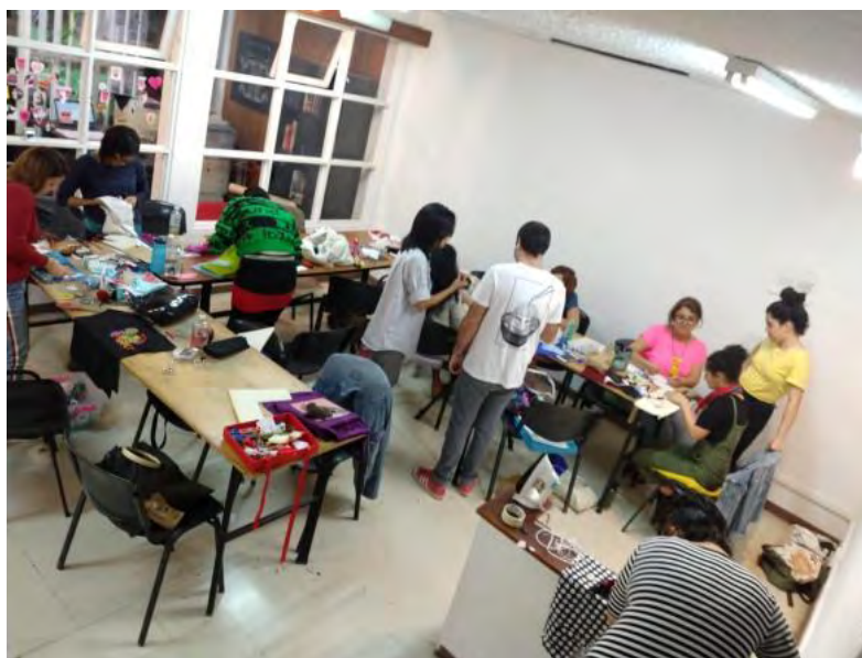
Figura 1: Jornada de trabajo.