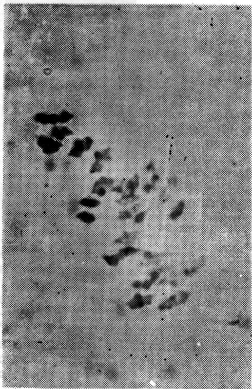
Fig. 3 — Metáfase I da Meiose no Híbrido F1 entre o Macho-estéril e o Pima S4 (26 II)

Em relação às médias de associação cromossômica, o híbrido que envolveu o Pima S4 apresentou valor de 78,57% para a combinação 26II, enquanto no TM1 esta percentagem foi de 56,66% (Tabela I e Figuras 3 e 4).