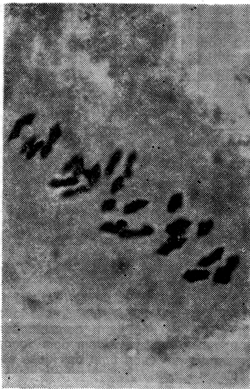
Fig. 2 — Metáfase I da Meiose no Macho-estéril (24 II + IV) (Dois bivalentes fora de foco)

No macho estéril, em 75 células estudadas, a média de associação cromossômica observada teve valores de 0,131 + 25,46II + 0,02III + 0,21IV. Neste material, a combinação 26II apareceu em 74,66% e as 24II + IV e I + 24II + III, em 16,00% e 2,66%, respectivamente (Tabela I e Figura 2).