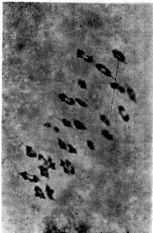
Fig. 1 — Metáfase I da Meiose na var. "Cruzeta Seridó" (26 II)

Em 33 células examinadas, da variedade "Cruzeta Seridó", foi encontrada a média de associação cromossômica de 0,36 para os univalentes e de 25,81 para os bivalentes. A combinação 26II foi observada em 81,81% das células examinadas, enquanto a 25II + 21, em apenas 18,19% (Figura 1).