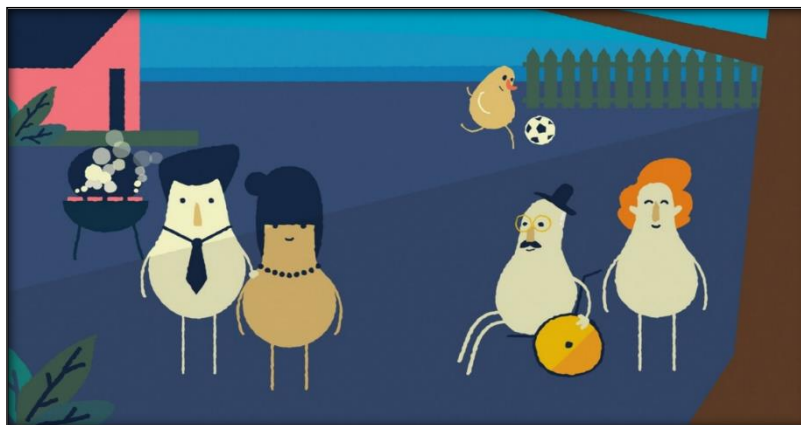
Figura 2: Esquema ilustrativo das cinco personagens de uma mesma família do vídeo sobre saúde bucal de pessoas idosas, UNA-SUS/UFRGS, 2023.

permitiu que todo o vídeo (animação) fosse organizado até o final. A Figura 3 ilustra um fragmento do storyboard definido com todos os seus elementos constituintes.