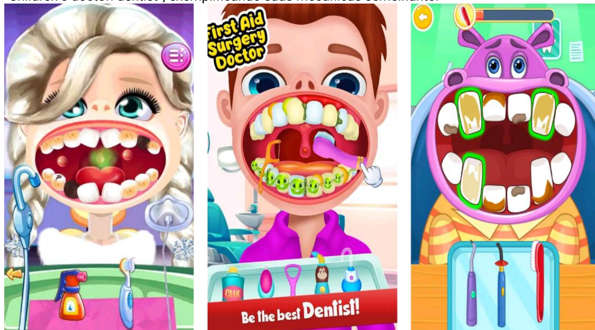
Figura 2: Prévias dos jogos “Little Dentist”, “Mouth Care Doctor - Crazy Dentist & Surgery Game” e “Children’s doctor: dentist”, exemplificando suas mecânicas semelhante.