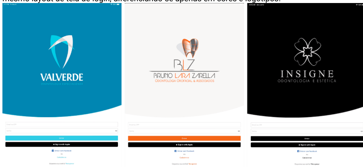
Figura 3: Exemplos de aplicativos de atendimento clínico encontrados no sistema iOS, possuindo o mesmo layout de tela de login, diferenciando-se apenas em cores e logotipos.

Sobre as subcategorias dentro da categoria de Gerenciamento Clínico, percebe-se que a seção de Fichas Clínicas é mais bem avaliada que Atendimento Clínico. Os aplicativos de fichas clínicas precisam ser cautelosamente desenvolvidos, visto que são passíveis de diversos erros no preenchimento de prontuários, como letra ilegível, rasuras, registros incompletos, identificação incorreta de profissionais, falta de assinatura de pacientes e outros 7 . Sobre os aplicativos de Atendimento Clínico, para Silva 11 , a automatização do sistema de atendimento a pacientes gera muitos benefícios, como a praticidade e a rapidez na execução dos procedimentos clínicos, auxiliando na realização de um diagnóstico mais preciso. Mostrando-se em um cenário semelhante com os aplicativos de jogos, foram encontrados muitos aplicativos de atendimento clínico quase idênticos, em sua maior parte, diferindo-se apenas nas cores e nos logotipos do dentista/clínica em que atua profissionalmente, como pode ser observado na Figura 3.