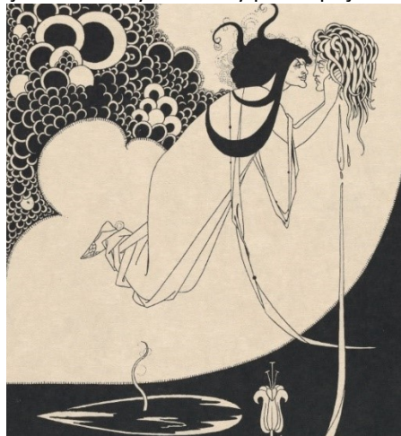
Figura 5: Detalhe da ilustração de Aubrey Beardsley para a peça Salomé , de Oscar Wilde (1893)

Talvez Gentileschi compreendesse que, mais do que um general qualquer a ser derrotado, Holofernes pudesse representar algo mais, e o impacto de sua obra superou a mera representação de uma narrativa bíblica e se tornou uma imagem de enfrentamento. Retornando à Salomé, também podemos fazer outras leituras sobre a personagem, seus atos e, também, seu sexo/gênero.