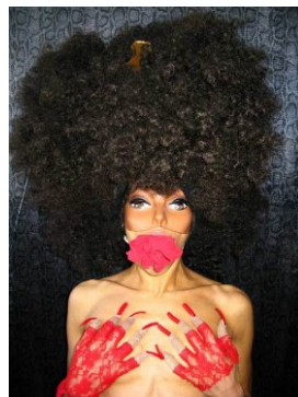
Figura 7: Fotografia de Narcissister em sua performance Every Woman (2008/9)

O mito de Narciso conta a história de um jovem caçador de beleza incomparável, o mais belo dos mortais, capaz de competir com qualquer deus. Após rejeitar as investidas da ninfa Eco, Narciso é punido, sendo sua punição uma paixão incontrolável por sua própria imagem. Ao se debruçar sobre as margens de um rio para matar sua sede, Narciso se encanta por seu próprio reflexo, e, ao tentar alcançá-lo, se afoga de modo trágico. O mito de Narciso permite diversas interpretações: egoísmo, ilusão, individualismo elevado a níveis trágicos de autoerotismo, entre outros. Talvez seja justamente por isso que o nome Narcissister , nome artístico de uma artista burlesca afro-americana de descendência marroquina, seja tão curioso. A união de Narciso com a palavra sister , traduzida como irmã, gera curiosidade. A união de nomes que lidam com termos díspares – um, ligado ao individualismo; o outro, à ideia de irmandade, coletividade, comunidade – soa como uma combinação improvável, mas potente. O autoamor que guarda em si o potencial de uma prática radical de amor coletivo é parte da força das performances de Narcissister.