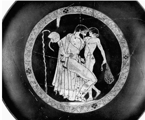
Figura 1: Pintura em cerâmica de Brygos