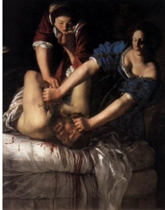
Figura 4: Giuditta che decapita Oloferne , pintura de Artemisia Gentileschi (1612-13)

feminina. Um interessante contraponto que podemos oferecer de uma imagem feminina usando seus poderes de sedução para fins violentos é a obra “Judite decapitando Holofernes”, da artista italiana Artemisia Gentileschi.