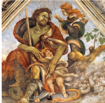
Figura 3: Detalhe de Adam , afresco de Filippino Lippi (1502)