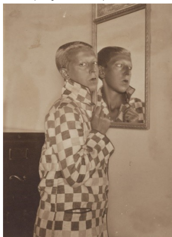
Figura 6: Untitled (Self-Portrait) , de Claude Cahun (1928)

Uma artista que flertou com o surrealismo, trazendo em seu trabalho todo seu potencial revolucionário ao mesmo tempo que buscava criar novos olhares e novas imagens – em especial no quesito identidade, gênero e sexualidade –, foi a francesa Lucy Schwob, melhor conhecida por seu pseudônimo artístico Claude Cahun. Apesar de seu tímido reconhecimento em vida, Cahun foi capaz de criar uma arte que discutia conceitos como identidade, gênero e olhar de um modo que permanece inovador.