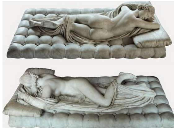
Figura 2: Hermafrodita dormindo , data e autoria desconhecidas