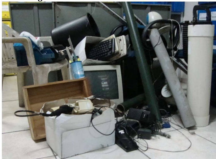
Figura 2 – Material de escritório descartado.