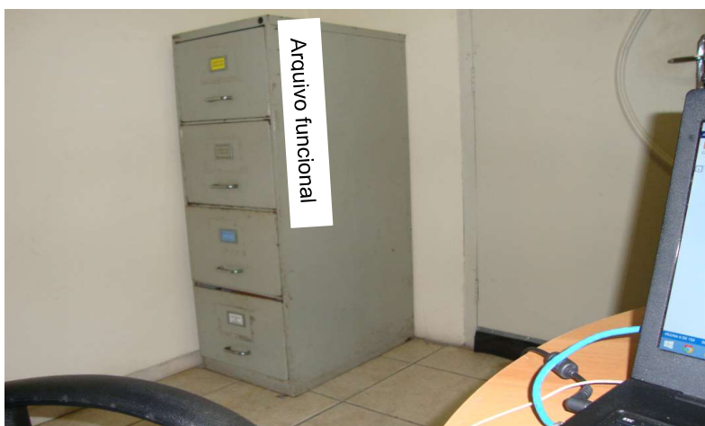
Figura 5 – Localização do arquivo funcional.

A primeira mudança foi no armário em que há um arquivo funcional dos colaboradores ativos. O armário é constantemente acessado para identificar advertências de funcionários, incluir pastas de novos funcionários e excluir informações dos que são desligados. Este se encontrava a uma distância de 18 metros da sala do arquivista e, a fim de proporcionar velocidade à busca, foi posicionado dentro da mesma, conforme pode ser observado na figura 5. Assim, o desperdício de tempo para chegar até o armário passou a ser quase nulo.