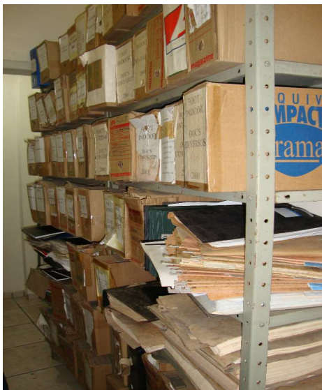
Figura 1 – Documentos descartados para reciclagem.

A relação dos documentos aprovada pela diretoria compreende 1130 caixas de arquivos, o que corresponde a mais de oito toneladas de papel, conforme apresentado na figura 1: