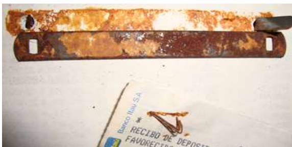
Figura 7 – Documentos antes do 5S.