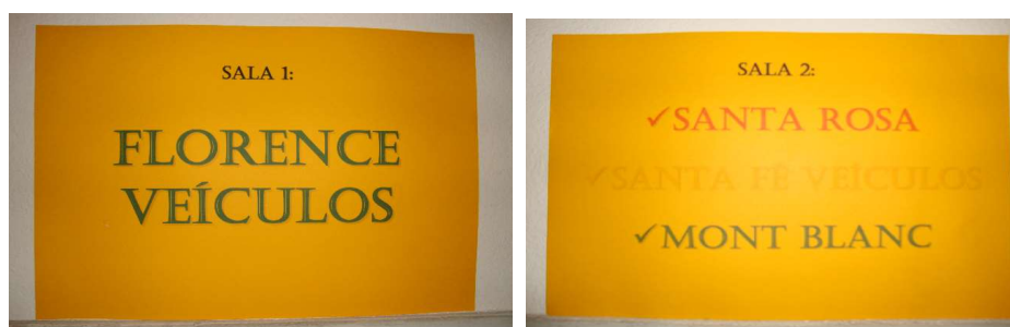
Figura 6 – Etiquetas de identificação das salas.

A última mudança deste senso foi confeccionar uma etiqueta na entrada de cada sala, informando qual empresa encontra-se arquivada em cada uma. Além de identificar o nome da empresa, a etiqueta foi impressa colorida, com a mesma cor da caixa que corresponde à empresa. Desse modo, em uma busca documental na sala dois para a empresa Santa Rosa, será possível identificar mais rápido quais caixas pertencem a ela, por ser a única que apresenta caixas vermelhas.