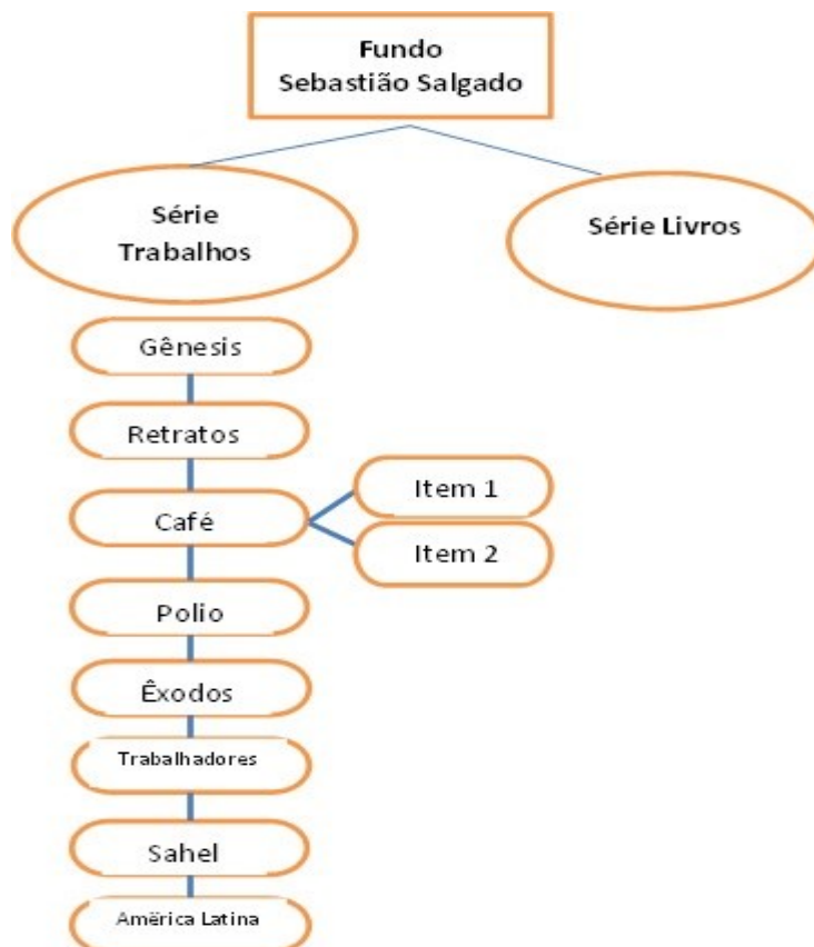
Figura 1 – Exemplificação dos níveis de descrição desenvolvidos.

A descrição arquivística é desenvolvida a partir da classificação, assim, consideramos a estrutura da figura 1 para o desenvolvimento da representação deste fundo documental: