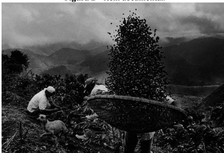
Figura 2 – Item documental.

Na descrição do item documental, no caso do fundo Sebastião Salgado, por se tratar de fotografia, foi fundamental entender o contexto antes de representá-la. As informações fornecidas pela imagem, por si só, não foram suficientes para uma descrição completa.