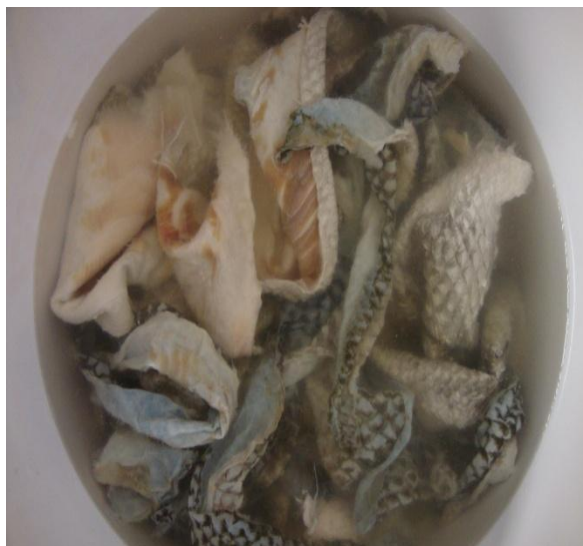
Figura 1 – Peles de tilápia ( Oreochromis sp.) na etapa de remolho.

b) caleiro : tem por finalidade a abertura da estrutura fibrosa para limpeza das fibras, liberação de escamas e posteriormente ajudar na maciez e na elasticidade. Nesta etapa são utilizadas água e cal virgem e tem duração de 12 horas, após essa etapa as escamas e a carne ainda presente na pele se soltam com certa facilidade; c) descarne : esse procedimento tem como objetivo remover escamas, restos de