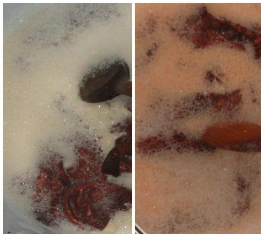
Figura 3 – Engraxe dos couros de tilápia ( Oreochromis sp.) curtidas com casca de cajueiro ( Anacardium sp.) e casca de aroeira ( Schinus sp.), respectivamente.

Nesta etapa que durou 8 horas o excesso de coloração presente nos couros era retirado do mesmo pelo processo normal de engraxe, e no final o couro apresentava-se mais oleoso e elástico (Figura 3);