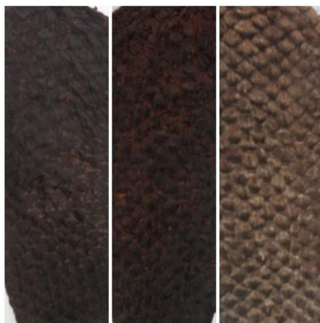
Figura 7 – Detalhe da coloração de couro curtido com casca de cajueiro, casca de aroeira e casca e gume de banana verde.

coloração na “flor” com o verso do couro apresentando-se fibroso e rudimentar (Figura 7).