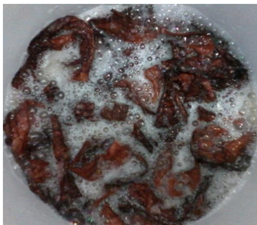
Figura 4 – Etapa de amaciamento em couro de tilápia ( Oreochromis sp.).

ao ser utilizado deixava o couro ressecado e sem elasticidade (Figura 4);