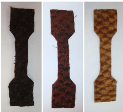
Figura 6 – Corpos de prova dos couros curtidos a partir de casca de cajueiro, casca de aroeira e casca e gume de banana verde, respectivamente.

Os corpos de prova, na forma de gravatas, foram cortados no sentido longitudinal, nas dimensões de 2cm x 2cm em cada ponta e 1cm x 5cm na parte central (Figura 6).