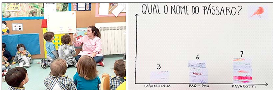
Figura 9 – Gráfico de barras e sua análise

Ainda na exploração do livro, várias crianças perguntaram: Qual o nome da rainha dos pássaros? A partir desta questão, foi solicitado às crianças que pensassem num nome a dar ao pássaro, estimulando a participação das famílias, para que no dia imediato se fizesse uma escolha em grande grupo. No dia seguinte, como seria expectável dada a idade das crianças, algumas não tinham pensado em qualquer nome nem conversado com os pais, mas, três delas haviam-no feito, e as opções eram: laranjinha , PaqPaq e Pavaroti . Deste modo, foi realizada a votação do nome do pássaro rainha recorrendo a um gráfico de barras (ver FIGURA 9). Em grande grupo, cada criança pintou um cartão de forma a identificar a sua opção, no qual o educador colocou o respetivo nome. Cada criança colocou o seu cartão no nome preferido. Alguns cartões foram colados com os nomes ao contrário, demonstrando estar na primeira fase de identificação do seu próprio nome.