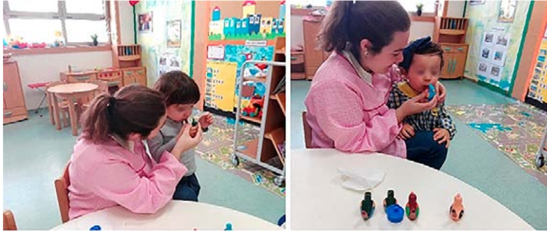
Figura 1 – Reação das crianças ao verem e ouvirem o passarinho d'água

visual e simbólica, sendo atribuída função e significado ao objeto que se apresentava com diferentes modelos, cores, padrões, entre outras características.