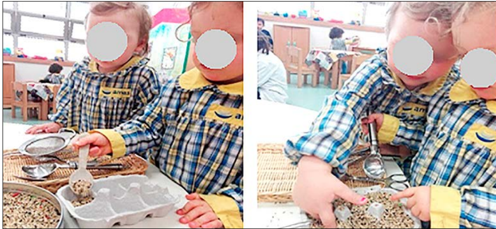
Figura 11 – Observação e comentário ao trabalho da colega

instrumento não era adequado para a transferência, algumas crianças tentavam em outras posições, mas outras desistiam e iam para um instrumento já conhecido (ver FIGURA 11). Ao fim de algum tempo de observação e de forma espontânea, ouviam-se alguns comentários como: Já chega; Não dá mais; Já está cheio.