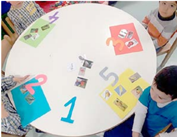
Figura 8 – O numeral

As crianças conseguiram fazer a correspondência cor-ave com alguma facilidade; no entanto, as imagens com aves mais coloridas suscitavam-lhes algumas dúvidas, sendo motivo para um diálogo sobre a melhor escolha a fazer em relação à cor. Apenas uma criança mostrou dificuldades na identificação das cores e, conseqüentemente, nesta correspondência. Relativamente aos pássaros intrusos , ou seja, aqueles que não tinham uma folha com a cor correspondente, as crianças questionavam-se sobre o paradeiro da folha para se fazer a correspondência, evidenciando