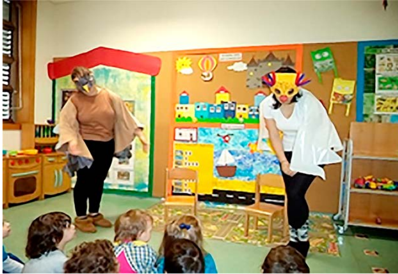
Figura 6 – Dramatização de A rainha das aves

ilustrações do livro, foram, também, abordados os números (contagem das aves), os quantificadores, as comparações e os conceitos topológicos.