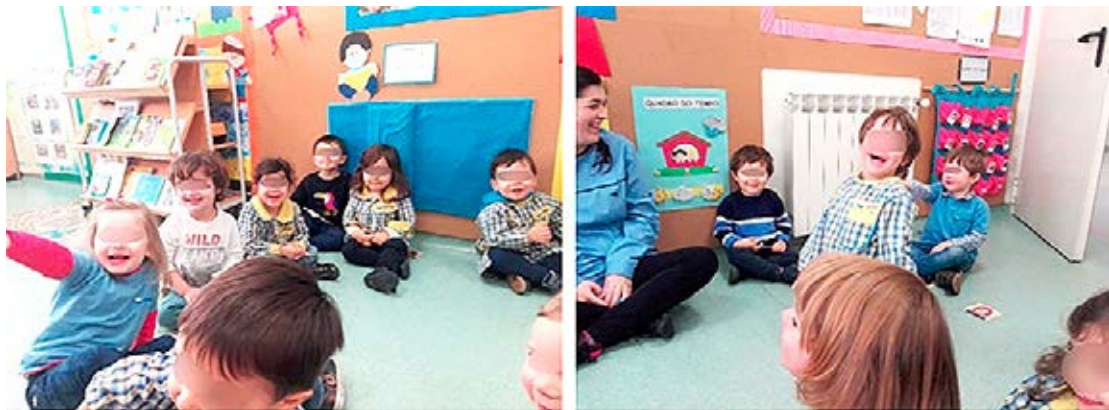
Figura 2 – Experimentação do passarinho d'água

Após a observação, seguiu-se a segunda e terceira etapas - o registo e a exploração -, que, dado o nível de desenvolvimento das crianças, foram em simultâneo. Cada criança pôde tocar, sentir e explorar um dos passarinhos à sua escolha e soprar para o ouvir a chilrear (ver FIGURA 2). Claro que, por serem objetos de barro e as crianças serem pequenas, houve uma atenção e cuidado especial por parte do educador, para que o objeto não se partisse, para além de que nem todas as crianças sozinhas conseguiam colocar o passarinho na forma correta para produzir o seu som. Neste momento, a pequenada fazia muitas perguntas e a educadora tentava responder da melhor forma possível para dar a conhecer a origem deste instrumento. Estas duas etapas contribuem para a consolidação do conhecimento já adquirido, desenvolvendo o diálogo, as reações e a capacidade de análise do objeto.