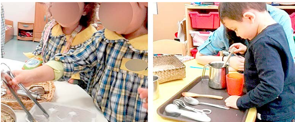
Figura 12 – Crianças nas transferências