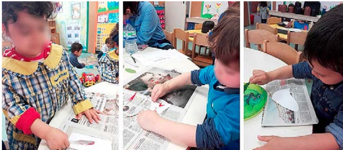
Figura 4 – Crianças a decorar a sua peça do puzzle com recurso a diferentes materiais

Esta atividade insere-se na última etapa da Educação Patrimonial, a apropriação. A educadora disponibiliza a cada criança uma peça de um puzzle que representa um passarinho com a forma do objeto cultural (ver FIGURA 4), e a criança tem a liberdade de a decorar com tinta ou colagens recorrendo a materiais naturais (penas, paus e folhas). Todas as crianças demonstraram uma capacidade de grande concentração e de envolvimento na tarefa.