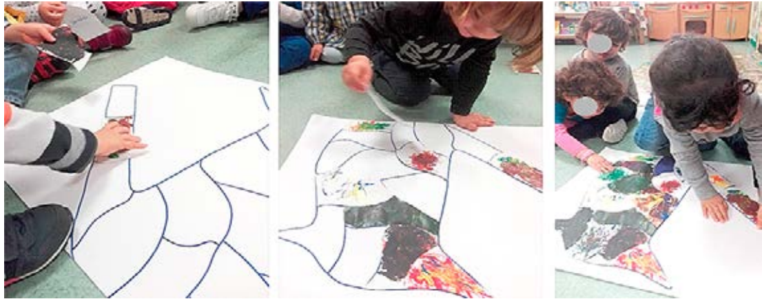
Figura 5 – Construção do Puzzle

No dia seguinte, em grande grupo, foi feito o puzzle com todas as peças, por vezes apoiada pela educadora (ver FIGURA 5).