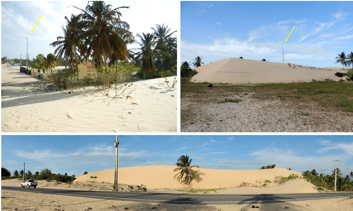
Figura 3 – Estrutura da Escola de Ensino Fundamental Nossa Senhora do Perpétuo do Socorro em 2012 e posterior ao processo de soterramento da escola (seta amarela) e de trecho da CE-187 na localidade do Venâncio