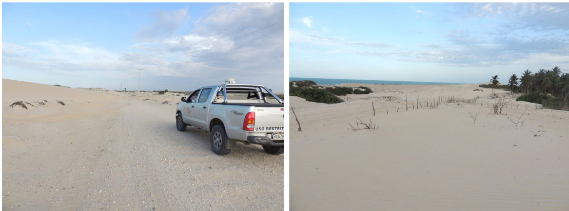
Figura 4 – Migração de dunas e soterramento de estrada de acesso à localidade de Curimã, com destaque para o loteamento de áreas com transporte eólico intenso