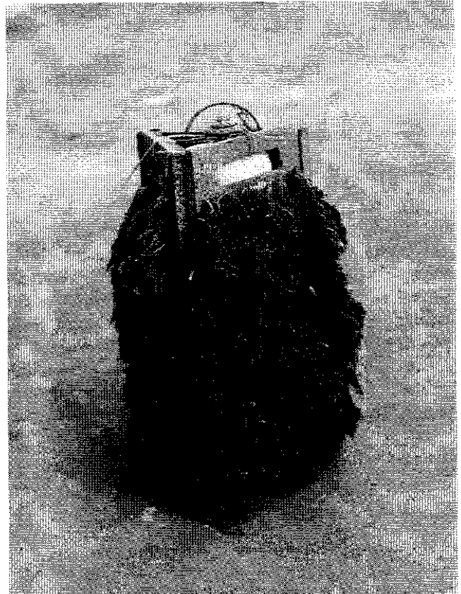
Figura 1 - Coletor flutuante de puerulus de lagostas desenvolvido no Laboratório de Ciências do Mar da Universidade Federal do Ceará.

Os coletores foram instalados na praia do Meireles, município de Fortaleza, numa área que, segundo Morais (1972), é formada por um quebra-mar de grande envergadura com características de pequena baía, tendo relativa proteção de influências externas das marés, resultante do processo de difração das ondas que vêm de encontro a este quebra-mar (figura 2).